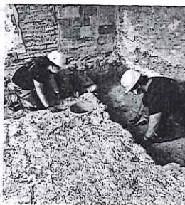
Alquería Falcó. AYUNTAMIENTO

los siglos II y III después de Cristo, incluye una inscripción completa en latín en que una mujer, de nombre Primitiva, se despide de su cónyuge, de nombre Hilaro. El hallazgo ha sido localizada a los pies del muro de la fachada y se trata de la primera inscripción completa encontrada en la última década en las excavaciones de Valencia.